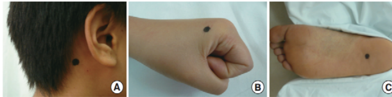
Figure 1. Three Anmian Acupoints

I punti Anmian sono particolarmente efficaci nel trattamento dell'insonnia di qualsiasi tipo e nel tuina il punto Anmian della testa può essere utilizzato insieme a tutta la linea che unisce Gb20 Fengchi e Te17 Yifeng .